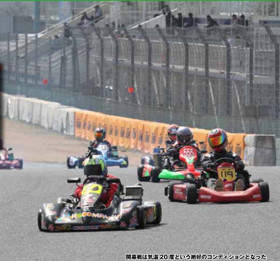
開幕戦は気温 20 度という絶好のコンディションとなった