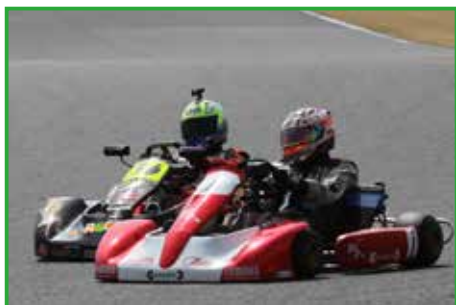
ミッションクラスの激しいトップ争い。競 り勝ったのは①ガレージ C 大宮ワークス