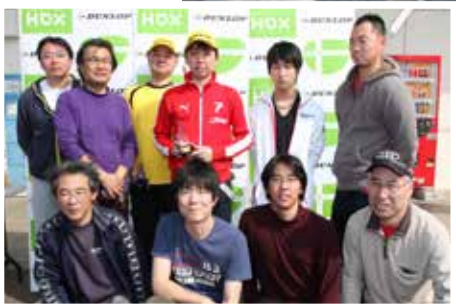
YZ85 エンジン搭載のミッションクラス

2015文部科学大臣杯 JAPANKART CUP with HDX シリーズ第1戦 開催コース/筑波サーキット (茨城県) 主催/日本スーパーカート協会 開催日/3月22日 天候/晴れ 路面状況/ドライ