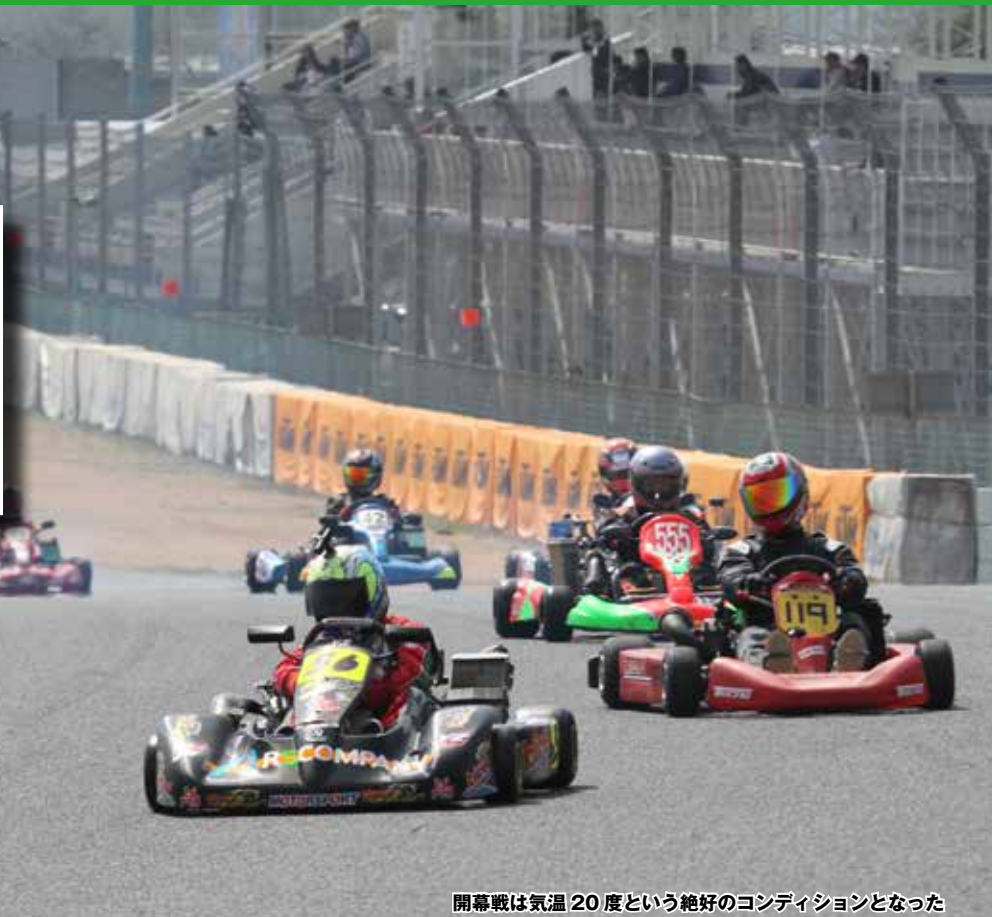
開幕戦は気温 20 度という絶好のコンディションとなった